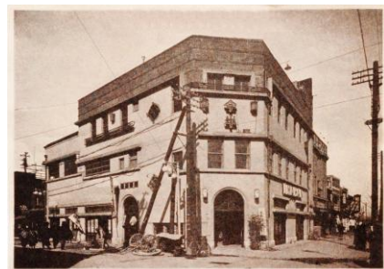
昭和初期頃の店舗外観

明治28年に本所吾妻橋で牛鍋屋として創業以来、牛肉一筋に歩み続けてまいりました。現在では名物「浅草今半流すき焼」を扱うレストラン事業のほか、佃煮や弁当の製造・販売、精肉の加工・販売を通じ、日本全国のみならず世界中の皆様に「浅草の粋」をお届けしております。