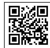
創業 130 周年特設ページ