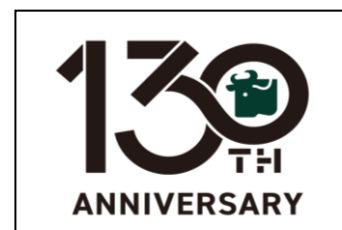
創業 130 周年記念ロゴマーク

「結び、つなぐ」をテーマとした創業 130 周年のロゴマークは、人と人、世代と世代、日本と世界が「つながる」イメージを表現しました。また、浅草今半グループが目指す「伝統の味の継承」と「豊かな食文化の創造」がいつまでも続くようお願いを込め、ロゴに無限大(∞)のマークを忍ばせました。